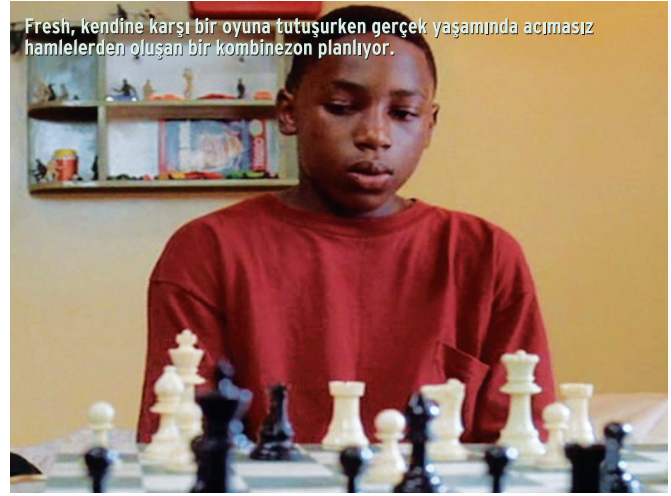
Fresh, kendine karşı bir oyuna tutuşurken gerçek yaşamında acımasız hamlelerden oluşan bir kombinasyon planlıyor.

cuk oyunların için vakit yok. Buraya gelirken tüm bu saçmalıkları evde bırakmalısın." Fresh suskunluğunu sürdürürken babasının öfkesi, sonunda yatışmaya başlar: "Pekâlâ, bugün hızlı oynayacağız. Yine de sana ufak ipuçları vermekten geri kalmayacağım. Bugün kendi çabanla ya batacak ya da çıkacaksın, çünkü senin elinden tutmak için her zaman yanında olamam. Pekâlâ, gerçek olana hazır mısın? Gelip almaya hazır mısın? Şah olmaya hazır mısın?"