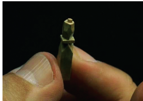
Kibrit çöpünden yapılmış bir satranç taşı.

Arcibel'in hemen komşu hücrelerinde bulunan mahkûm Palacios duvara vurarak daha ilk günden onunla iletişim kurmaya çalışır. Arcibel bu iletişimde kullanacağı aracı çıkarır cebinden; gazetede satranç takımından geride kalan tek yadigâr olan pırlıl pırlıl, siyah bir piyon.