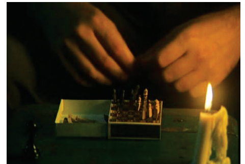
Arcibel kibritten satranç takımı ile oynuyor.