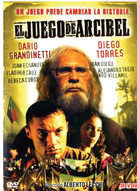
"Arcibel'in Oyunu" filminin DVD kapağı

dan. Düşüncelerim en çok Arcibel'in ilk arkadaşları Palacios ve El Rengo'ya takılıyor. Berlin duvarının yıkılışını komünizmin bütün dünyaya yayılması olarak görece kadar romantiktiler. Che Guevara'nın devriminde bizzat onun tarafından dışarı salınacaklarına inanıyorlardı. Uzun uğraşlardan sonra onları boşuna beklememeleri için ikna ediyorum. Birlikte kaçıyoruz o hapisaneden, günler sürüyor Boliviya'ya varmamız. Bizi bulan gerillalar iyi tanıyor yanımdaki iki kafadarı, komutanlarına götürüyorlar hemen bizi. "Merhaba" diyorum, "meslektaşız biz." "Siz de devrimci misiniz?" diye soruyor elimi kuvvetle sıkarken. "Hayır" diyorum; "şairim ben, satranç oyuncusu ve doktor." "Evet ben de anlarım bunlardan biraz." diyor gülerek. Palacios'un kibritten takımıyla oynarken fark ediyor satrancı ne kadar özlediğini. Öyle güzel ki gözlerim kamaşıyor. Ona bakınca içimden şiir yazmak geçiyor ama yapamıyorum. Akif'in "Bir hilâl uğruna, yâ Rab, ne güneşler batıyor!" dizesi geliyor aklıma nedense. Ve o uğursuz gün gelip çatıyor, hiçbir kurşunun ona ulaşmasına izin vermiyorum, beni delip geçmeden.