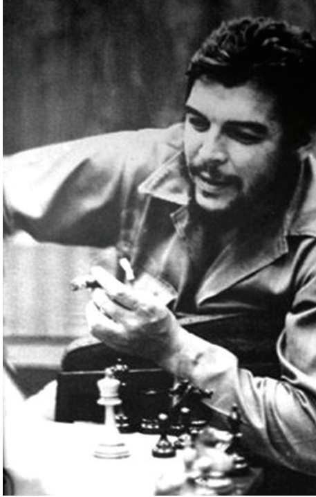
Che Guevara, satranç oynuyor.

ruyor. Filmin öncelikle çok başarılı bir hapisane filmi olduğunu belirtmeliyim. Arcibel'in bir satranç köşesinde yanlışlıkla yorumlanan devrimci mesajının yine satranç benzeri bir oyun ile otoriter rejimin sonunu getirmesi oldukça ironik. Arcibel'in Pablo'ya diktatörden yoksun bir ülkeyi hayal etmesini sağlması piyonların şahı gerçekten de köşeye sıkıştırmasıyla sonuçlanıyor.