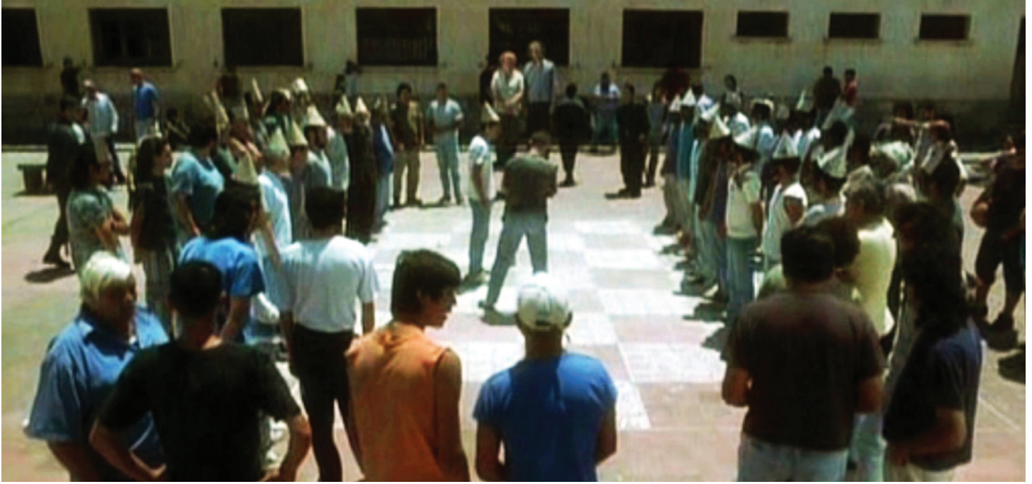
Arcibel'in doğum günü için hazırlanan canlı satranç takımı.

bir başarı gösterir. Yinelenen oyunlarda yeni stratejiler geliştirerek muhteşem bir savaşçı olduğunu kanıtlar. Sonunda oyunun mucidini yenerek Miranda'nın kontrolünü eline geçirir. Gün gelir Pablo başarılı bir planla hapisneden de