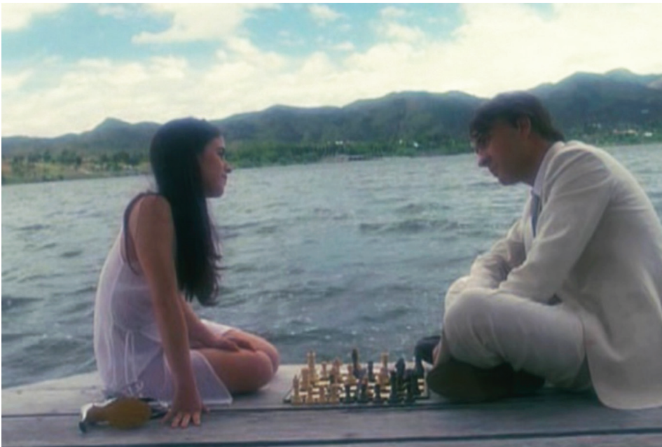
Arcibel, hapisane dışında bir yaşam düşünüyor.

Arcibel'in Oyunu, satrancı filmin ana omurgasına yerleştirdikten sonra Latin Amerika'nın geleneğinde bulunan totalitarizm ve ona tepki olarak oluşan devrim tutkusunu başarıyla birleştirerek sağlam bir bütünlük oluştu-