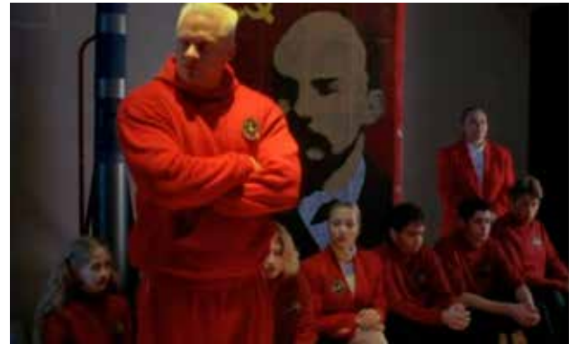
Rus takımını maçı kazanacağından emindir.

Rus takımının kasabaya gelişi gerçekten de çok görkemlidir: Antrenöründen oyuncusuna kadar kırmızı şık bir üniforma giyen bu disiplinli takımın en gösterişli elemanı kuşkusuz güzelliğiyle dikkat çeken kadın takım kaptanıdır. Güznel kadın en çok Shaun'un ilgisini çekmiştir. Maç öncesi akşamında, spor salonunda, kasabalıların ve her iki takımın katıldığı muhteşem bir parti verilir.