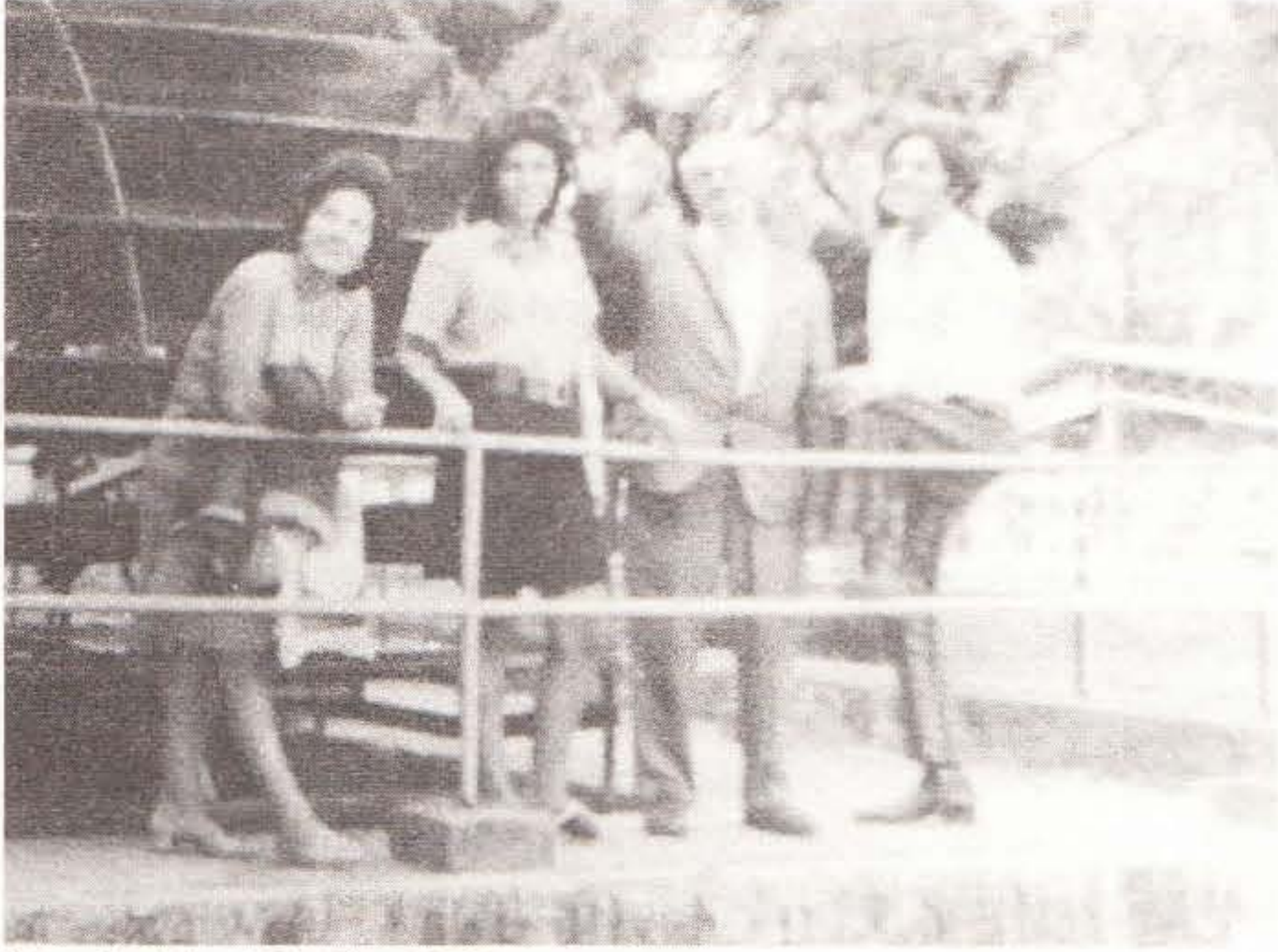
İlyadis Ailesi Çark'ta, 1970