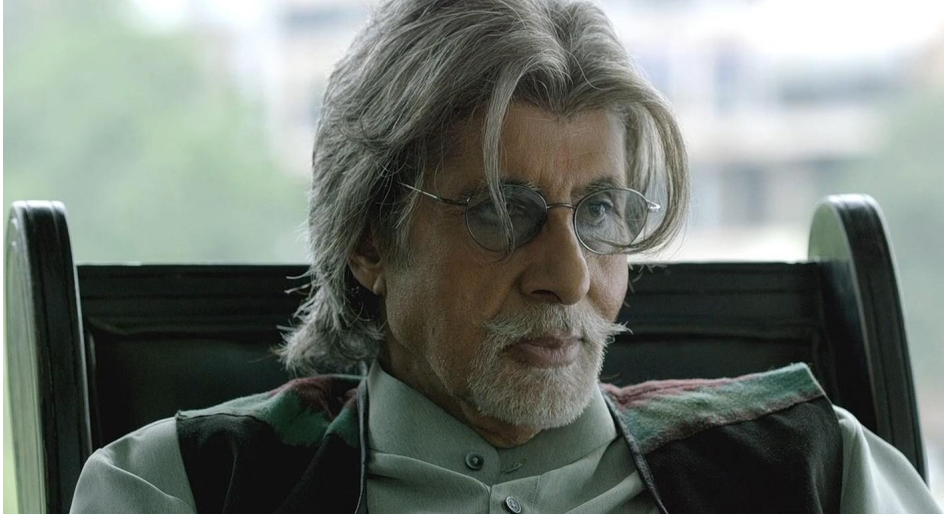
Bollywood'un efsanevi aktörü Amitabh Bachchan, satranç ustası Panditji rolünde bir kez daha devleşiyor.

bir konum kullanılmıştır (Diyagram 2 ve 3). Filmin ana temasının gösterildiği bu konumda bile aşikâr bir hata yapılmış olması filmin önemli bir satranç danışmanlığı almadığını gösteriyor.