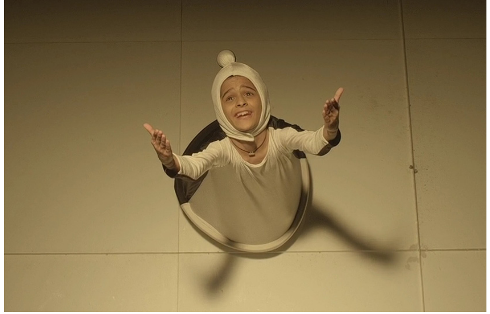
Küçük piyon Yaratıcı'sına yakarıyor: "Tanrım, kötü şahı nasıl alt edebilirim?"

Vezir, Hintli yönetmen, yapımcı ve senaryo yazarı Vidhu Vinod Chopra'nın eserine dayanıyor. Chopra'nın senaryoyu ilk olarak 2001'de gün yüzüne çıkardığı, Dustin Hoffman gibi ünlü