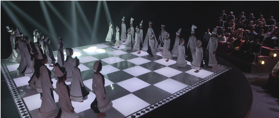
"Piyon ve Şah" piyesi izleyici önüne çıkıyor.

Bütün bu olumlu yönlerine karşın film satrançsever izleyiciye doyurucu satranç konumları sunamıyor. Daanish Ali'nin satranç okulundaki ilk oyununda maça yoğunlaşmadığı ve sevimli küçük bir kıza kolayca mat olduğu görülür (Diyagram 1). Bu sahne incelendiğinde satranç tahtasının ters olduğu, şah ve vezirin yanlış yerleştirildiği fark edilir. Kale piyonunun feda edilmesi ile kalenin açılan hatta daha etkili olmasının anlatıldığı sahnede de uygunsuz